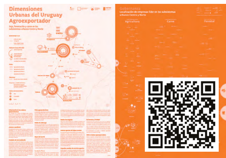
Figura B.01. Dimensiones urbanas del Uruguay agroexportador: una caracterización de los subsistemas urbanos norte y centro en cuanto matriz territorial de las cadenas productivas de la soja, la forestación y la carne.

Los ejes temáticos combinan las diferentes herramientas analíticas que resultan de una perspectiva metodológica interdisciplinaria con aportes de la economía urbano–regional y geografía económica, asociando técnicas de análisis territorial con base en sistemas de información geográfica y