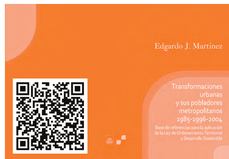
Figura B.07. Transformaciones urbanas y sus pobladores metropolitanos 1985–1996–2004: base de referencias para la aplicación de la Ley de Ordenamiento Territorial y Desarrollo sostenible. Portada del libro (2012). Más información en el QR, o haciendo clic en la imagen.