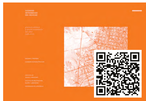
Figura B.05. Ciudades intermedias del Uruguay: procesos urbanos y acondicionamiento del suelo (1985–2011). Portada del libro (2020). Más información en el QR, o haciendo clic en la imagen.