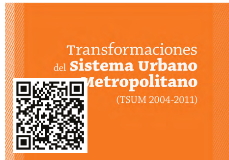
Figura B.06. Transformaciones del sistema urbano metropolitano 2004–2011. Portada del libro (2016). Más información en el QR, o haciendo clic en la imagen.