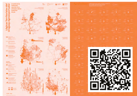
Figura B.02. Lógicas territoriales del Uruguay agroexportador: un análisis de implicancias espaciales de las principales cadenas productivas agroindustriales del país. Póster (2019) elaborado por el G. I. 1703 CSIC/ITU/Udelar. Más información en el QR, o haciendo clic en la imagen.

Mediante un enfoque sistémico y la interpretación de diversas bases de datos de flujos de personas entre los centros urbanos, se distinguen y caracterizan a distintas escalas tanto el sistema general como los subsistemas y los nodos. Para ello, se recurre al procesamiento e interpretación en paralelo de tres fuentes principales: datos del Tránsito Promedio Diario Anual de la Dirección Nacional de Vialidad (MTOPI) 2004–2014; circuitos y flujos de transporte de pasajeros interurbanos 2015 (relevados por el equipo de investigación); y datos sobre la movilidad por motivos laborales del Censo INE 2011), y tres fuentes complementarias: caudal de flujos de transporte de pasajeros por rutas, patrones de movilidad interurbana por trabajo, y circuitos del transporte colectivo.