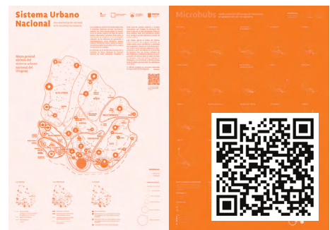
Figura B.03. Sistema urbano nacional del Uruguay: una caracterización con base en la movilidad de pasajeros. Póster (2019) elaborado por el G. I. 1703 CSIC/ITU/Udelar. Más información en el QR, o haciendo clic en la imagen.